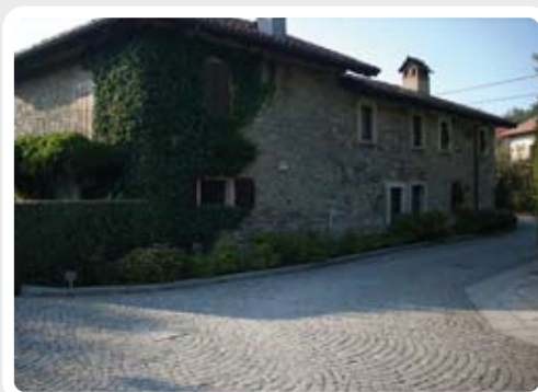
< Scorcio del Nucleo di Coquo.