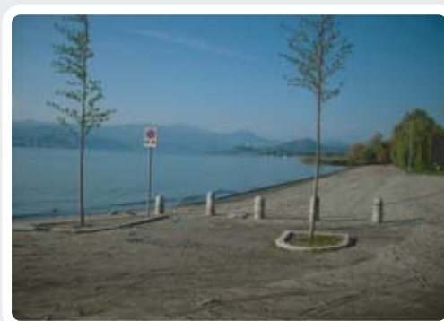
Vista panoramica dalla Spiaggia di Lisanza.>