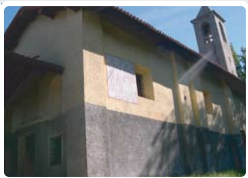
< la Chiesa di San Quirico e la sua Meridiana.