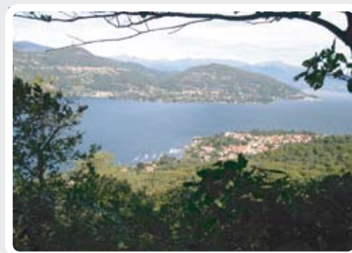
Vista panoramica sul Lago Maggiore dal Monte San Quirico. >