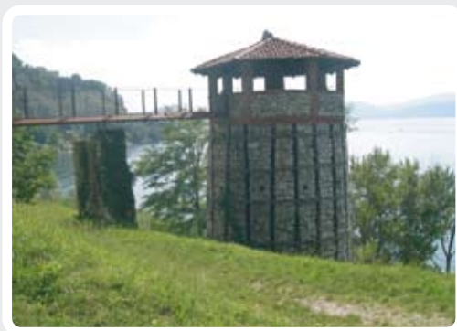
Fornace affacciata al Verbano.>