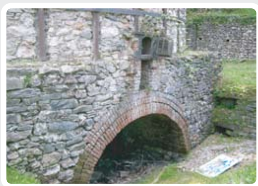
< Antica Fornace realizzata con muratura a secco e mattoni.